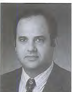
C. COSTA NEVES

Nasceu em 1939. Frequentou o Centre de Formation de Journalistes (Paris). É Presidente do Centro Nacional de Cultura, Presidente da Comissão Nacional da UNESCO, membro do Conselho de opinião da RTP e membro do Conselho Geral da Comissão Nacional para os Descobrimientos Portugueses.