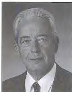
EURICO DE MELO

Nasceu em 1925. Licenciado em Eng a Química. Desempenhou diversos cargos em todos os escalões partidários, nomeadamente Vice-Pres. da Com. Pol a Nacional. É membro do Conselho Nacional do PSD. Eleito Deputado à A.R. pelo círculo de Braga em 85, 87 e 91. No Governo foi Min o de Estado e da Adm. Interna, Vice-Prim o Min o e Min o da Defesa Nacional.